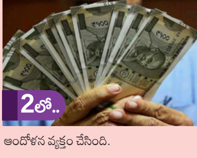
ఆందోళన వ్యక్తం చేసింది.

నకిలీ నోట్ల ముద్రణ మాత్రం ఆగడం లేదని స్పష్టమవుతోంది. దేశీయ బ్యాంకింగ్ వ్యవస్థలో నకిలీ కరెన్సీ నోట్ల గుర్తింపు 2025-26 ఆర్థిక సంవత్సరంలో ఏకంగా 5.7 శాతం పెరిగిందని భారత రిజర్వ్ బ్యాంక్ తన తాజా వార్షిక నివేదికలో వెల్లడించింది. మార్కెట్లో చెలామణిలో ఉన్న నోట్లలో ప్రధానంగా ముఖ విలువ రూ.200, రూ.500 ఉన్న నోట్ల ఎక్కువగా నకిలీలు సృష్టిస్తున్నట్లు ఆర్బీఐ